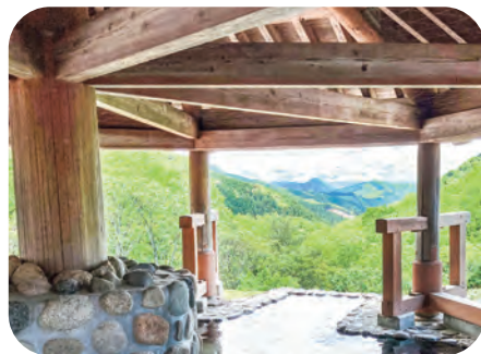
▲露天風呂からの景色

え、4月よりリニューアルオープンしました。そんな矢先による緊急事態宣言が岡山県で発令され、休業を余儀なくされましたが、施設ではロッカーやイス、扉などあらゆる箇所を定期的に消毒し、感染防止対策を行い、営業を行っています。 温泉の隣は、食事処「のとろ