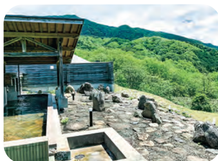
▲天空の湯 露天風呂

る館」や「のとろ原キャンプ場」があり、澄みきった水や空気でアウトドアライフを楽しむことができます。夏は、ひらめのかみ取りをして、キャンプに満点の星空を見ながらのんびり温泉に浸かり、贅沢な時間を過ごすことができます。 コロナ禍でも非日常を楽しむことができる施設となっております。是非この夏は、のどろ温泉へ行ってみては、いかがでしょうか。