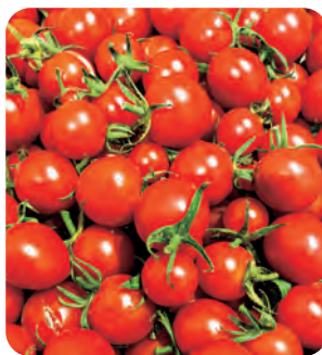
▲出荷しているズッキーニとトマト