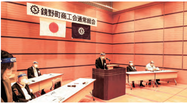
▲感染症対策を講じた会場内の様子