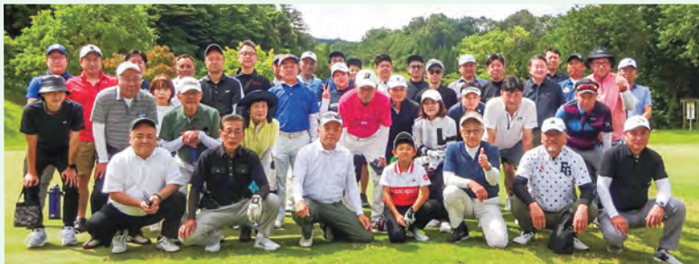
▲参加者全員で集合写真

今回の開催予定日は未定ですが、日程が決まり次第、毎月の配布物でお知らせしますので、多数のご参加をお待ちしています。