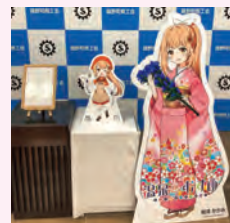
▲新パネルお披露目

今後も県内外に鏡野町の魅力をPRしていけるよう地域と共創し、活動していきたいと思っています。