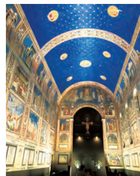
▲大塚国際美術館内