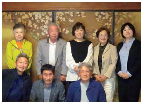
▲日本料理銀座にて記念撮影