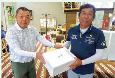
▲クラブハウスにて授与式