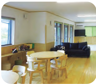
▲子どもの居場所にじいる施設内

「子ども第3の居場所」は全国でも年々増加しています。「子ども第3の居場所」とは、家庭や学校に次ぐ、第3の居場所として子どもたちが安心して過ごせる場所を提供し、子どもたちが将来、自分らしく過ごせる力を育んでいけるように支援する場所のことです。「子どもの居場所」にはB&G財団から鏡野町が助成を受けて、国や地方公共団体などと連携し、開設されました。