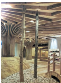
▲おもちゃ美術館内

会員も感動していました。参加者から「岡山県北部の山間部に位置する鏡野町の素晴らしい環境のもと木材を利用した特産品や加工品ができれば。」との声も聞きました。昼食は海鮮物を食べながら会