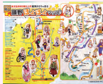
▲奥津かがみを巡る鏡野観光マップ