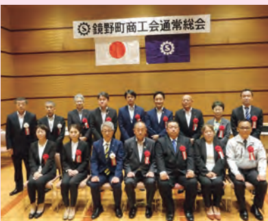
▲出席した被表彰者と記念撮影